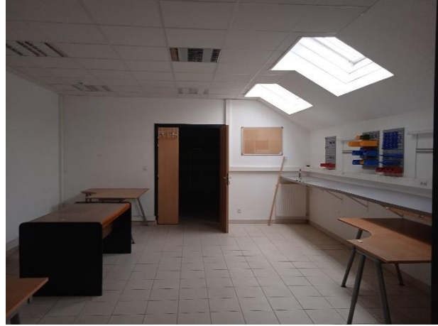
Figure 3 - Photo intérieur