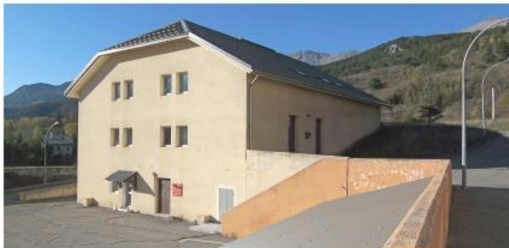
Figure 1- Plan de situation