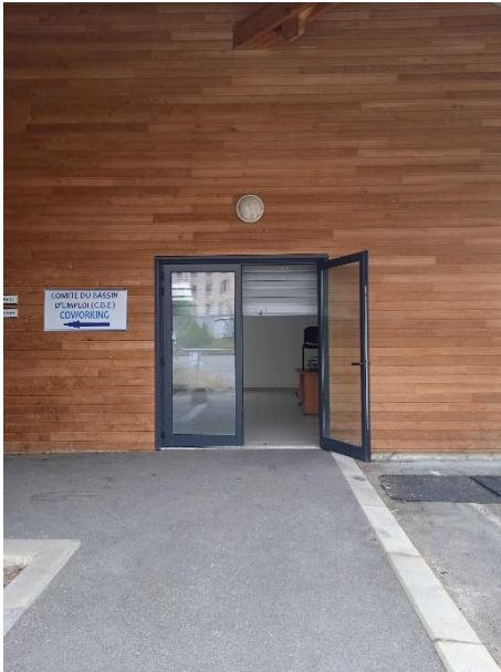
Figure 2- Devanture